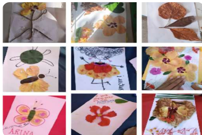
Evento extencionista Brinquedoteca Universitária Criação | Crédito: PRAES/UNEB.