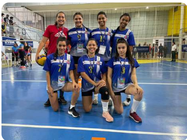
Representação estudantil na JUBA

A Pró-Reitoria de Assistência Estudantil (PRAES), no ano de 2023, juntamente com a Pró-Reitoria de Extensão (PROEX), acompanhou e deu suporte às Atléticas no quesito apoio a eventos esportivos, alimentação e hospedagem e na consolidação do Regimento das Atléticas.