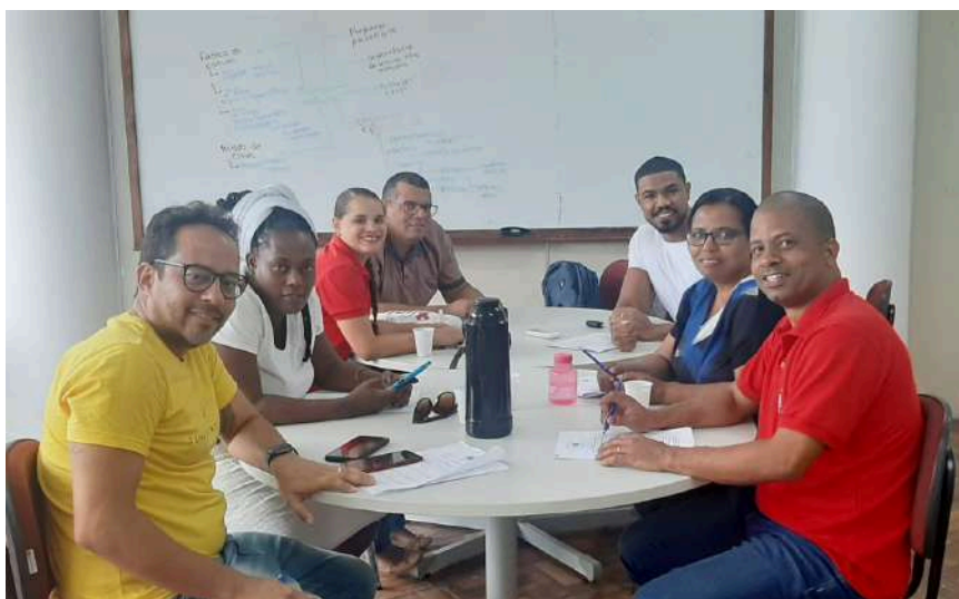
Oficina de Editais

Esse processo integrado reflete o compromisso da PRAES em aprimorar suas ações, promovendo uma gestão eficaz e transparente em benefício dos estudantes.