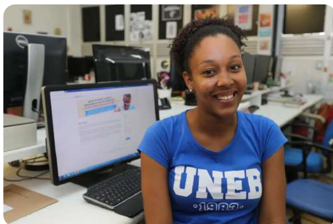
Discente Programa Partiu Estágio

Estas e outras reflexões estão detalhadamente retratadas no relatório técnico disponível no site institucional: