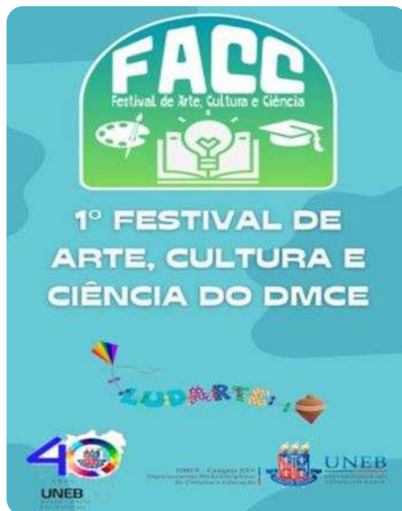
Banner | Festival de Arte, Cultura e Ciência do DMCE/XXV | Crédito: Acervo do NUPE

Encerrando o semestre 2023.2, organizamos o 1º Festival de Arte, Ciência e Cultura do DMCE. Este evento teve como propósito promover a socialização dos conhecimentos acadêmicos e culturais entre a comunidade interna a universidade e a sociedade.