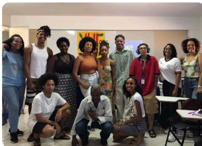
Novembro Negro DMCE

No mês de novembro de 2023, o Departamento Multidisciplinar de Ciências e Educação de Lauro de Freitas/BA promoveu, com o apoio da PRAES, um evento que foi uma iniciativa dos integrantes do C.A, com a proposta unânime de celebrar a importante data que é o Dia da Consciência Negra. Durante o evento, houve uma mesa de debate para os convidados, abordando os temas: Educação antirracista e valorização da cultura negra.