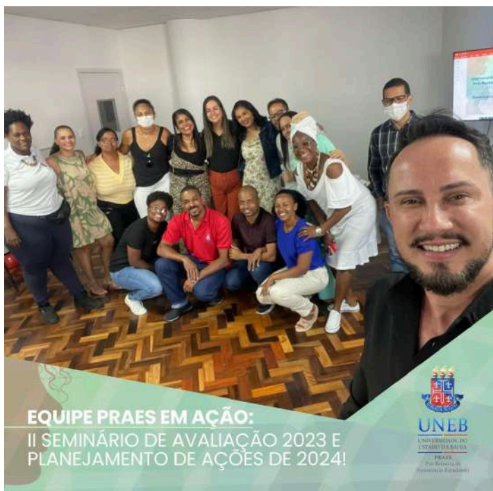
II Seminário de Avaliação 2023 e Planejamento 2024

Em dezembro, a equipe da PRAES se reuniu para o Seminário de Avaliação e Planejamento. Cada setor avaliou suas ações ao longo de 2023 e delineou planos para o próximo ano. Durante o evento, foram fornecidas orientações para a elaboração do Plano de Ação de 2024, consolidado nesse mês, fevereiro de 2024, sob acompanhamento realizado pela Gerência de Assuntos Estudantis.