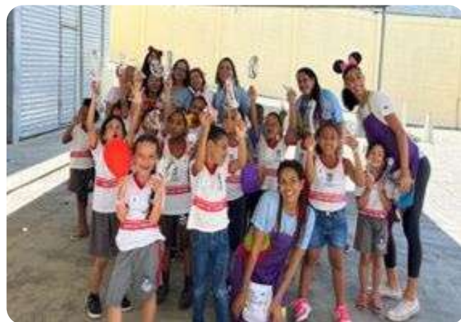
Semana da criança em outubro/2023

Em outubro, acolhemos a Semana da Criança de 03 a 05 de outubro de 2023, recebendo a visita de 300 crianças do município em dois turnos, envolvendo 20 estudantes bolsistas e voluntários. Mantemos uma parceria contínua com a Rede de Brinquedotecas, incluindo a ação da UNEBrinque junto à Brinquedoteca Paulo Freire, no Campus Avançado de Lauro de Freitas.