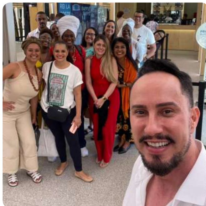
Registro IV Ciclo Formativo PRAES