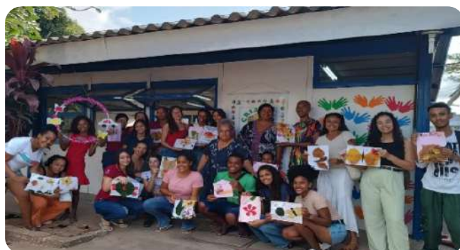
Evento extencionista Brinquedoteca Universitária Criação | Crédito: PRAES/UNEB.

Esta proposta de formação docente e promoção do brincar busca contribuir significativamente na trajetória acadêmica e profissional dos/as estudantes da UNEB. Pretendemos que essas experiências impactem positivamente na prática pedagógica desses futuros professores e criem engajamentos com a área educacional, com o curso e com a ambientação universitária, criando, também de forma lúdica, caminhos da Permanência Estudantil unebiana.