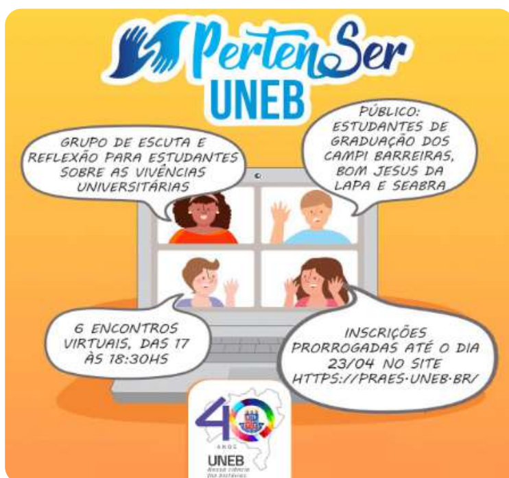
Banner Projeto Pertense UNEB

Os participantes identificaram como aspectos positivos da atividade a oportunidade de escutar e aprender com o outro, o compartilhamento de estratégias para lidar com dificuldades e a promoção de reflexões sobre a própria trajetória estudantil.