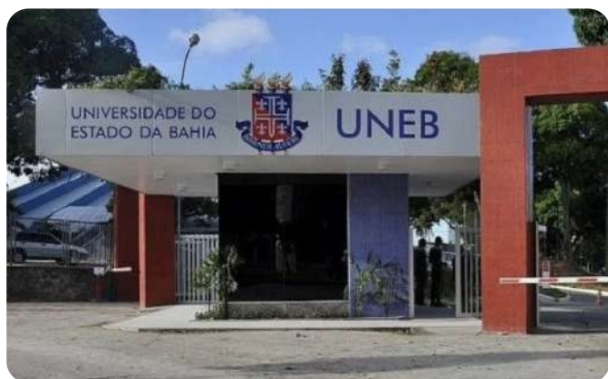
Fachada UNEB Campus I | Crédito: Reprodução

Assistente Social e atualmente Gerente de Assistência Estudantil (PRAES/UNEB)