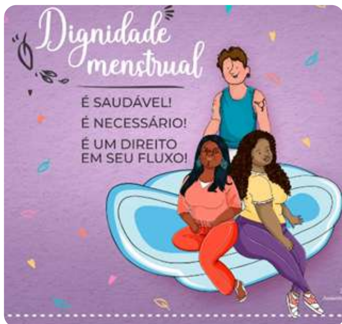
Banner Dignidade Menstrual UNEB

O Projeto Pobreza e Dignidade Menstrual da UNEB, destinado para estudantes que menstruam e, preferencialmente, residentes das Casas de Estudantes, tem como objetivo principal consolidar as Políticas de Assistência Estudantil voltadas para essa temática, estruturando-se em ações que vão desde a distribuição de absorventes nos diversos Departamentos da universidade, até à realização de lives, rodas de conversas e outras atividades que proponham uma maior reflexão e conhecimento sobre o assunto.