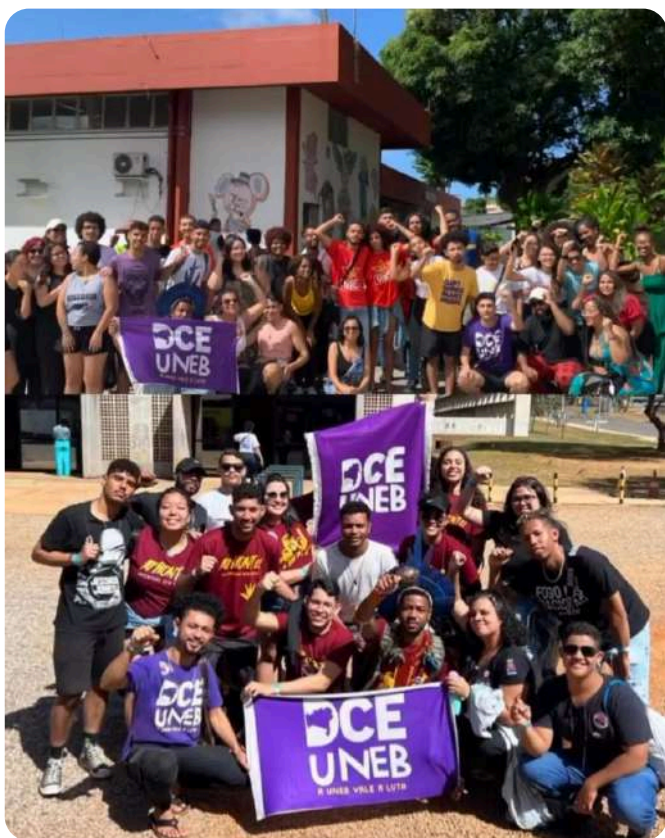
Discentes reunidos para Congresso da 59° UNE

A Pró-Reitoria de Assistência Estudantil (PRAES) se compromete em enriquecer a formação acadêmica dos estudantes, também através da promoção ativa sua participação em eventos que transcendem as salas de aula. Por meio da Gerência de Programas e Projetos, a PRAES oferece suporte significativo, possibilitando a presença dos alunos em congressos, seminários, simpósios e encontros.