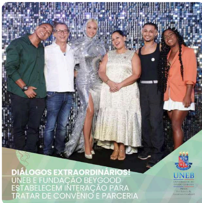
Encontro da Reitoria e discentes da UNEB com Beyoncé e Fundação BeyGOOD

No final de dezembro (21), vivenciamos a Premiere Renaissance no Centro de Convenções de Salvador, um evento magistral organizado pela Fundação BeyGood. A Reitoria da Uneb, juntamente com representantes da Serint e PRAES, abrilhantaram a ocasião. Com a participação de 79 estudantes da Uneb, incluindo cotistas, bolsistas dos Programas PRAES e representantes do Movimento Estudantil, o evento foi marcado pela diversidade e engajamento acadêmico.