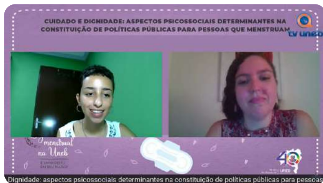
Dignidade: aspectos psicossociais determinantes na constituição de políticas públicas para pessoas que menstruam | Live Dignidade Menstrual UNEB

Nessa perspectiva, A PRAES realizou, em agosto de 2023, uma live com o tema Cuidado e Dignidade: aspectos psicossociais determinantes na constituição de políticas públicas para pessoas que menstruam, que teve como palestrante a professora Daniela