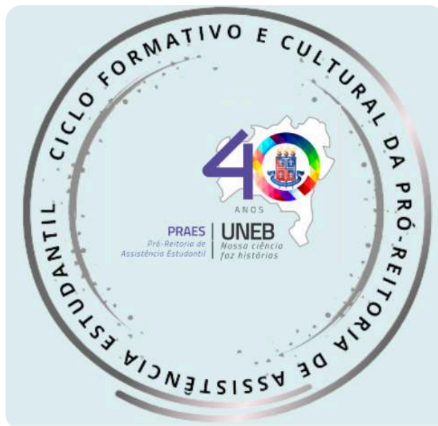
Banner IV Ciclo Formativo PRAES | Crédito: Acervo da PRAES

Sigamos para o V Ciclo Formativo e Cultural da PRAES, em 2024!