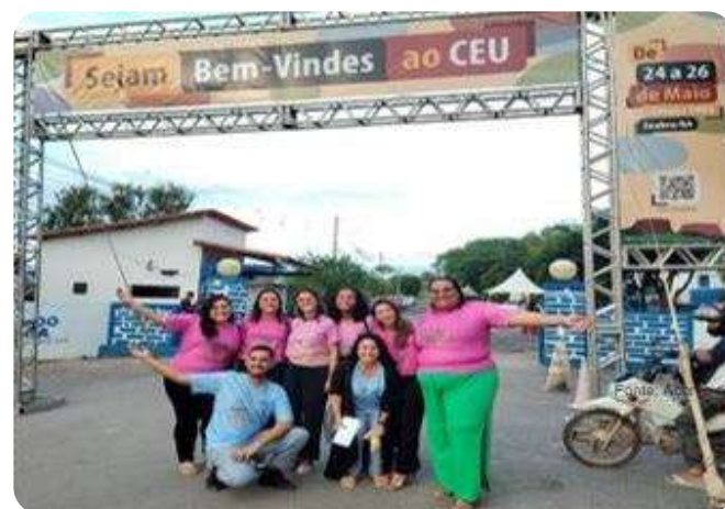
II Congresso Universitário da UNEB (CEU)

No dia 30 de maio, foram desenvolvidas Oficinas Brincantes para Professores da Rede Municipal de Ensino/SEMED, além de vivências lúdicas no Campus, onde os 14 monitores dos projetos participaram ativamente. No dia 31/05, realizaram um Workshop de História da Arte e vivenciaram o Desenho com Modelo Vivo, envolvendo 20 alunos. Espalharam jogos e brinquedos