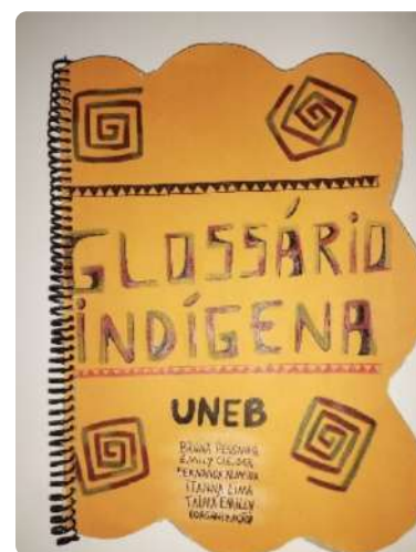
Glossário indígena elaborado pelas crianças

A ação envolveu a contação de histórias infantis de autoria indígena por parte dos estudantes universitários, seguida pela confecção de um glossário indígena ilustrado pelas crianças das escolas públicas de Itinga. Além de proporcionar momentos lúdicos e educativos, o projeto teve como objetivo promover a valorização da cultura indígena e o fortalecimento dos laços entre a universidade e a comunidade local.