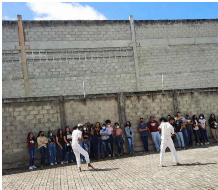
Registro Universidade Brincante

Desde 2021, a ação ocorre virtualmente, passando para a presencialidade em 2022, e segue até o presente ano. Seu principal objetivo é celebrar a Semana Mundial do Brincar, fortalecendo o direito de brincar para as infâncias e destacando sua importância em todas as etapas da vida. Com essa experiência, fortalecemos em cada participante a força do Brincar livre. Discutimos e difundimos o Brincar como direito, celebrado em 28 de maio.