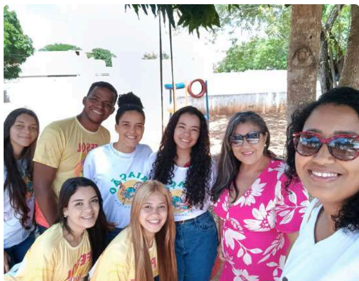
Equipe responsável pela iniciativa