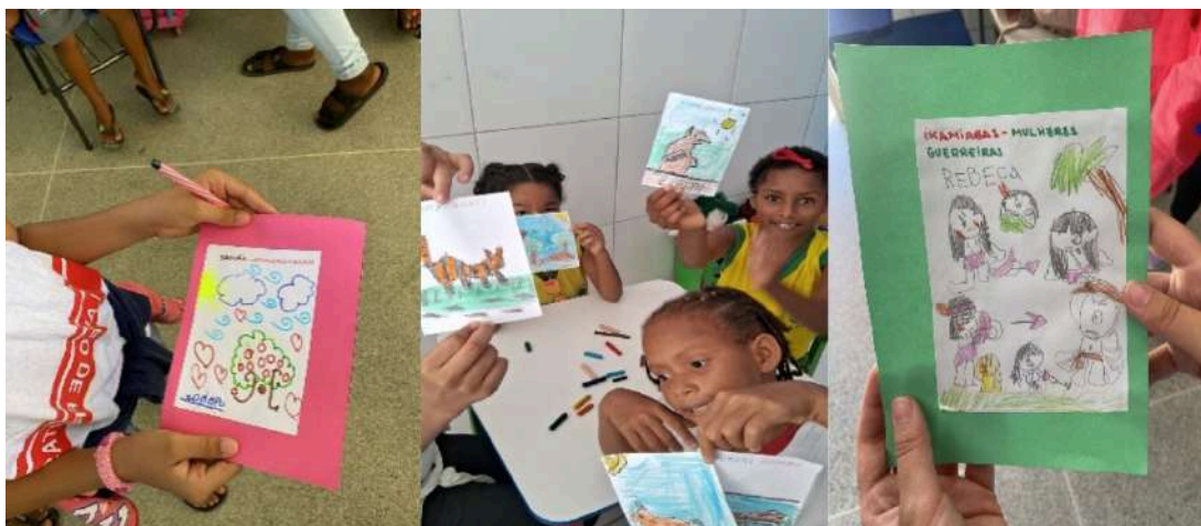
Crianças criando desenhos de valorização da cultura indígena

No segundo semestre de 2023, um projeto de resgate cultural e educacional foi realizado com sucesso nas escolas básicas públicas do bairro de Itinga, em Lauro de Freitas. Desenvolvido no âmbito do curso de Licenciatura em Pedagogia no Campus de Lauro de Freitas da UNEB, o projeto teve como objetivo principal a valorização da cultura indígena através da literatura infantil e da construção de um glossário indígena ilustrado.