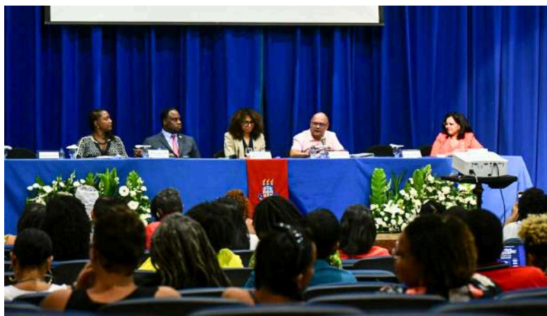
Delegação americana na UNEB

Em vigor desde 2008, o Japer é um acordo bilateral contra o racismo que opera por meio de uma parceria entre comitês da sociedade civil e do setor privado. O plano abrange as disparidades raciais de acesso à educação, saúde, justiça ambiental, igualdade de oportunidades econômicas e acesso igualitário ao sistema de justiça para a população negra e indígena.