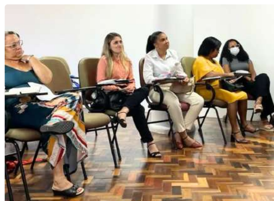
II etapa do Seminário de Planejamento PRAES | Créditos: Acervo da PRAES

Essa abordagem visa garantir o contínuo aprimoramento das práticas de fomento à Assistência e Permanência Estudantil na UNEB.