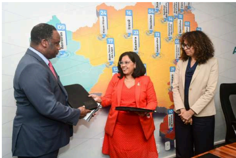
Delegação americana na UNEB

No dia 26 de março de 2024, uma delegação de congressistas afro-estadunidenses esteve em Salvador para participar do evento "Japer em Ação: Unindo Congresso e Sociedade Civil pela Igualdade Racial no Brasil e EUA". O evento foi realizado no Teatro da Uneb. O objetivo foi discutir o plano de ação conjunto entre Brasil e Estados Unidos para eliminar a discriminação étnica e racial e promover a igualdade. O evento foi transmitido pelo canal da TV Uneb no YouTube, que apoiou o encontro.