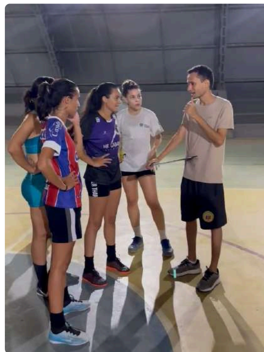
Seleções masculina e feminina de handebol da UNEB | Créditos: @EsportesUneb

O processo de preparação, realizado de forma conjunta entre estudantes de diferentes cursos, departamentos e campi , torna ainda mais significativa a representação da UNEB na competição.