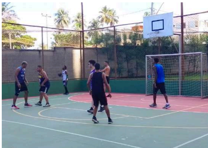
Seleção masculina de basquete da UNEB

Os atletas passaram por seletivas técnicas para a formação dos times em seis modalidades de esportes de quadra: futsal feminino e masculino, vôlei feminino e masculino, handebol feminino e basquete masculino. Além da atuação competitiva, as equipes também contam com a participação de discentes e profissionais na comissão técnica, organizadora e de comunicação. Essa iniciativa estudantil surgiu da necessidade de tornar a prática esportiva coletiva mais frequente, viável e integrada.