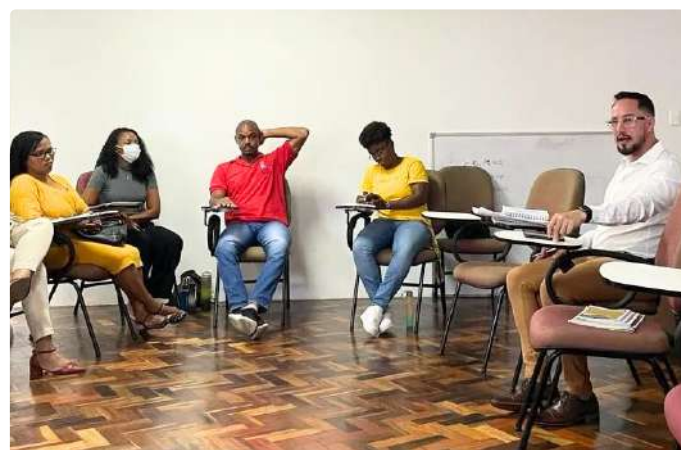
II etapa do Seminário de Planejamento PRAES

O ENCONTRO OBJETIVOU: proporcionar uma análise minuciosa das ações realizadas ao longo do ano anterior por cada setor da PRAES. Durante as discussões, as equipes foram convidadas a identificar tanto os pontos positivos alcançados quanto as áreas que demandam melhorias. Além disso, foram delineadas as metas e objetivos para o ano de 2024, abrangendo todas as dimensões da permanência estudantil atendidas pela PRAES.