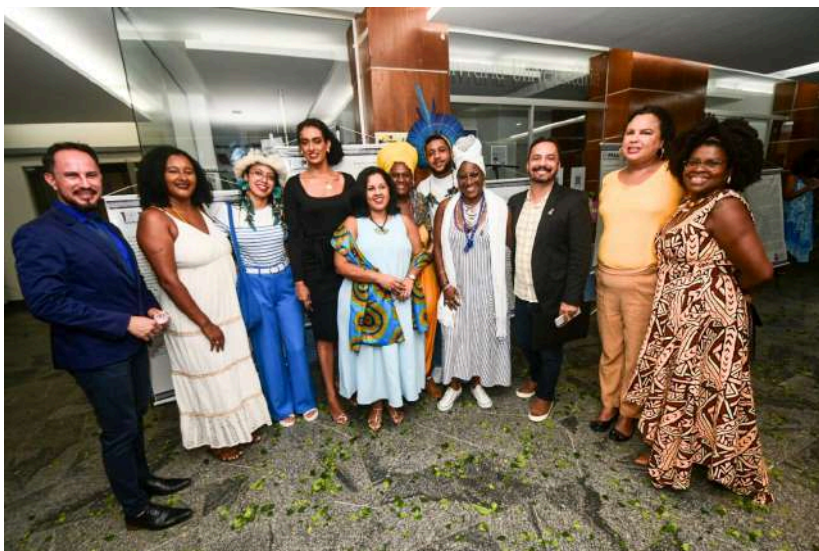
Celebração dos 10 anos da PROAF na UNEB - Campus I

A Uneb realizou a cerimônia de 10 anos de institucionalização da Pró-Reitoria de Ações Afirmativas (Proaf) no dia 26 de março de 2024, no Teatro da universidade, no Campus I, em Salvador.