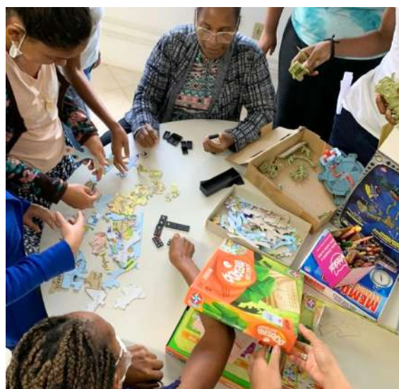
Registro Universidade Brincante