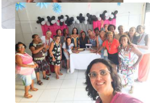
Encontro do projeto Ludarte

O projeto teve início com a formação dos(as) monitores, que foram capacitados acerca dos processos grupais para o manejo de grupos de encontro. Paralelamente, foram realizadas ações de divulgação e busca ativa dos participantes, resultando na formação de dois grupos com 15 participantes cada, que se reuniam semanalmente, às segundas e terças-feiras, durante uma hora e trinta minutos.