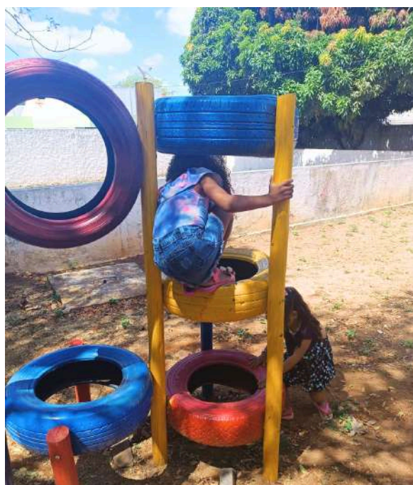
Crianças brincando durante a iniciativa

Durante todo o dia, crianças de todas as idades estiveram brincando livremente na sala de brincar, onde puderam realizar brincadeiras, utilizar diversos brinquedos, jogos e soltar a imaginação. Além disso, as atividades lúdicas aconteceram também ao ar livre, em um parque de pneus localizado na frente das salas da Brinquedoteca, um espaço bastante arborizado que favoreceu, dentre tantas possibilidades inventivas, a de ter contato com paisagens e repertórios lúdicos naturais. Para a realização dessa ação, foi possível contar com a contribuição do Núcleo de Pesquisa e Extensão - NUPE e dos/as estudantes do curso de Pedagogia que participaram como monitores/as no desenvolvimento de toda a ação junto a Brinquedista e a Coordenadora do Projeto, uma experiência lúdica que contribui para a formação de professores/as brincantes.