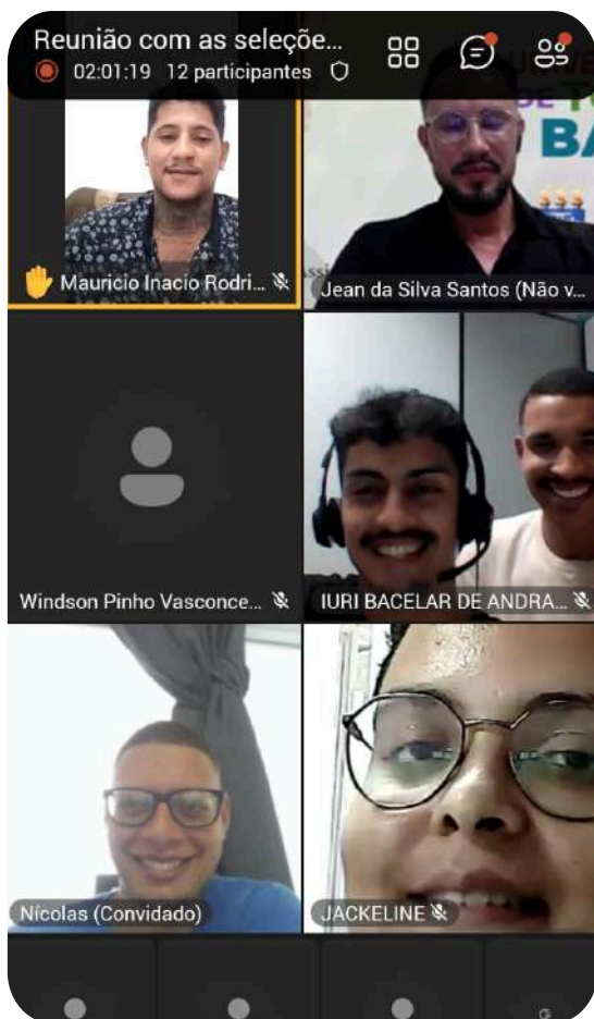
Reunião com as seleções esportivas da UNEB | Créditos: Acervo da PRAES

Texto por: Ana Muniz e Nilton Conceição Jesus