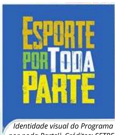
Identidade visual do Programa 'Esporte por toda Parte' | Créditos: SETRE (Gov/BA)

No dia 26 de janeiro, foi realizada uma reunião estratégica entre importantes entidades, incluindo a Pró-Reitoria de Assistência Estudantil (PRAES), a Superintendência dos Desportos do Estado da Bahia (Sudesb), a Secretaria Especial de Articulação Interinstitucional (SEAI) e a Pró-Reitoria de Gestão e Desenvolvimento de Pessoas (PGDP), com o intuito de traçar planos para ampliar as atividades esportivas na Universidade do Estado da Bahia (UNEB).