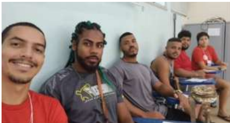
Estudantes de Educação Física da UNEB presentes no evento na UFF