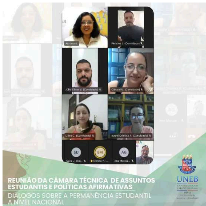
Reunião da Câmara da Abruem

Durante o encontro, foram discutidas diversas pautas relevantes relacionadas à permanência estudantil, com o objetivo de promover a articulação nacional entre as universidades públicas estaduais.