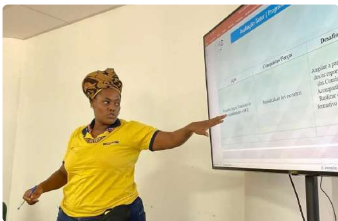
Exposição da Coordenação de Moradia no Seminário

No dia 28 de fevereiro, a Coordenação participou da 2ª Etapa do Seminário de Planejamento da PRAES (2023-2024) no Edifício Jequitaia, em Salvador-BA. O evento teve como objetivo dar continuidade ao planejamento das ações setoriais para o período 2023-2024 da PRAES. Na ocasião, a intervenção do Programa de Moradia destacou as ações de 2023, conquistas recentes e desafios para o ano corrente.