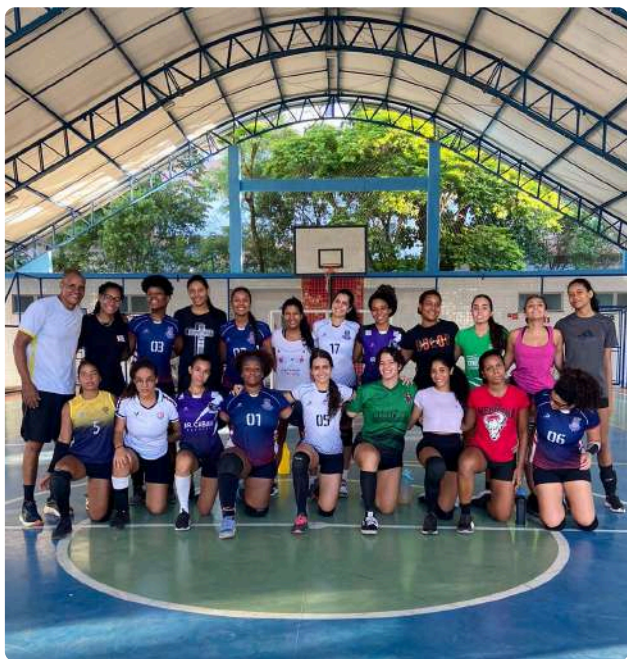
Seleção feminina de vôlei da UNEB

Cerca de 100 discentes da UNEB estão se preparando para representar a universidade nos Jogos Universitários da Bahia (JUBA) 2024, na etapa Cruz das Almas, que ocorrerá na Universidade Federal do Recôncavo da Bahia. Os jogos estão programados para acontecer entre os dias 01 e 05 de maio, e a preparação das equipes começou em março, contando com o apoio da PRAES, da PROEX e da SUDESB.