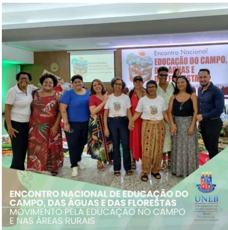
Representação administrativa da UNEB no Encontro Nacional de Educação do Campo, das Águas e das Florestas

Aconteceu entre 28 a 02 de março, em Salvador, o Encontro Nacional de Educação do Campo, das Águas e das Florestas. O evento reuniu educadores, universidades, entidades, movimentos sociais do campo e agentes do estado para discutir e propor medidas visando a atualização, ampliação e fortalecimento da Política Nacional de Educação do Campo.