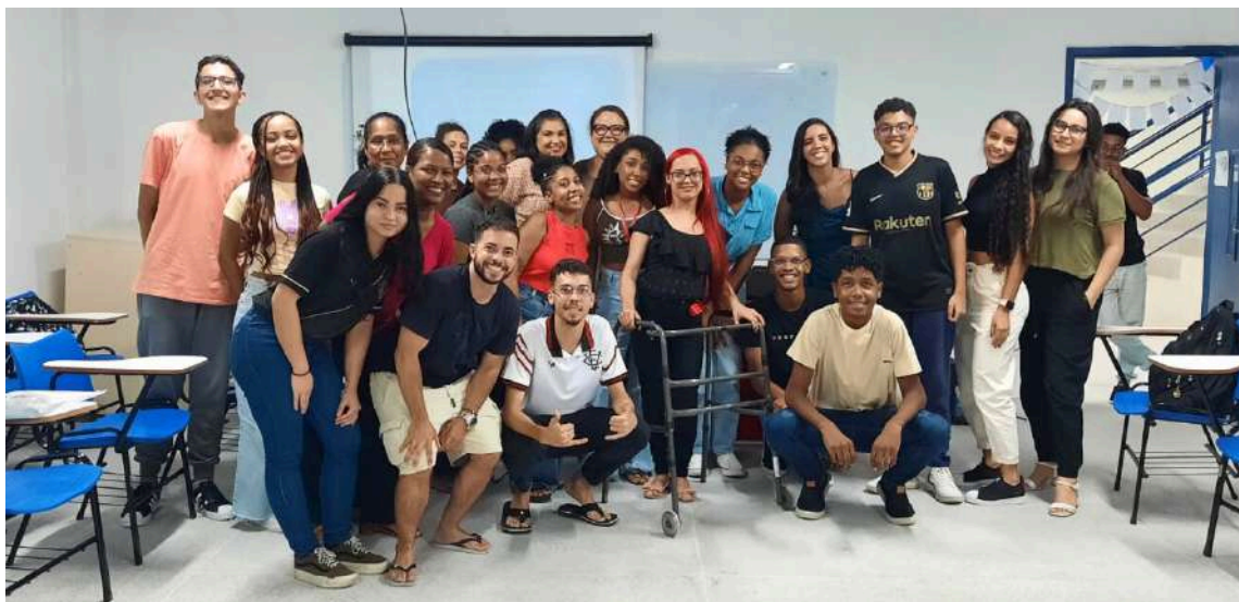
Participação da PRAES na Semana de Integração UNEB 2024.1 no DCH-I, Salvador/BA

Texto por: Alana Mara S. dos A. Ferreira