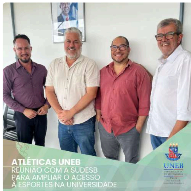
Na foto, as representações da PRAES, Sudesb, SEAI e PGDP

Essa iniciativa tem como objetivo integrar esforços e recursos para potencializar as atividades esportivas na UNEB, proporcionando uma experiência acadêmica mais completa e enriquecedora para os estudantes. Este é um passo importante rumo à promoção de um ambiente universitário ainda mais inclusivo e dinâmico.