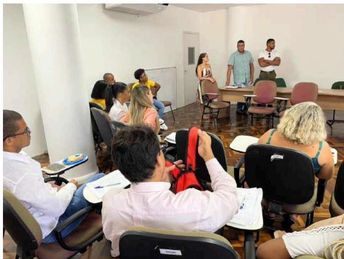
II etapa do Seminário de Planejamento PRAES