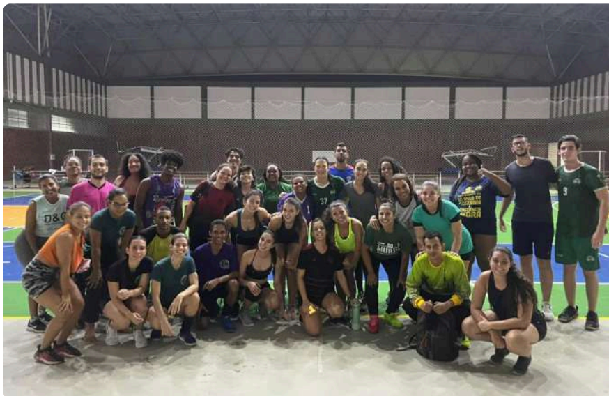
Seleções masculina e feminina de handebol da UNEB

O processo de preparação, realizado de forma conjunta entre estudantes de diferentes cursos, departamentos e campi , torna ainda mais significativa a representação da UNEB na competição.