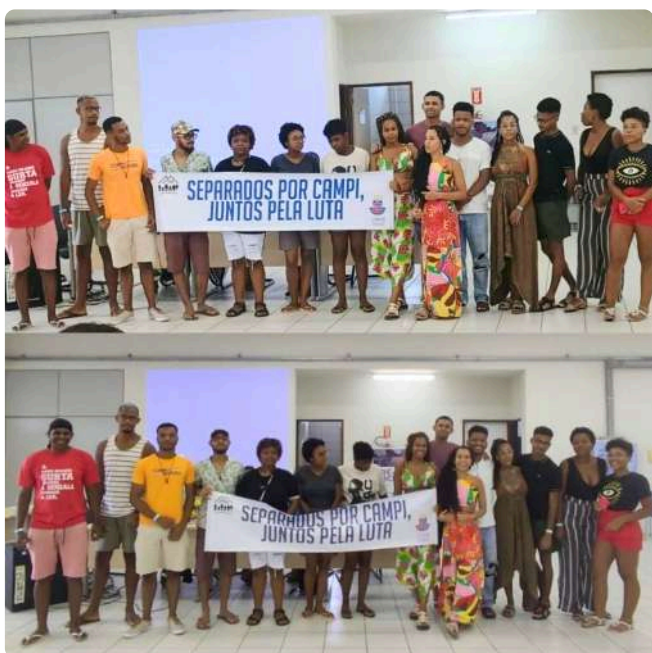
Grupo de estudantes da UNEB no 45º Pré-Ence

Entre os dias 24 e 28 de janeiro de 2024, ocorreu o 45º Pré-Ence - Encontro Nacional de Casas de Estudantes, sediado na UFPE, no Campus de Recife. A PRAES desempenhou um papel fundamental de fomento a participação dos discentes de 18 discentes da universidade neste importante evento.