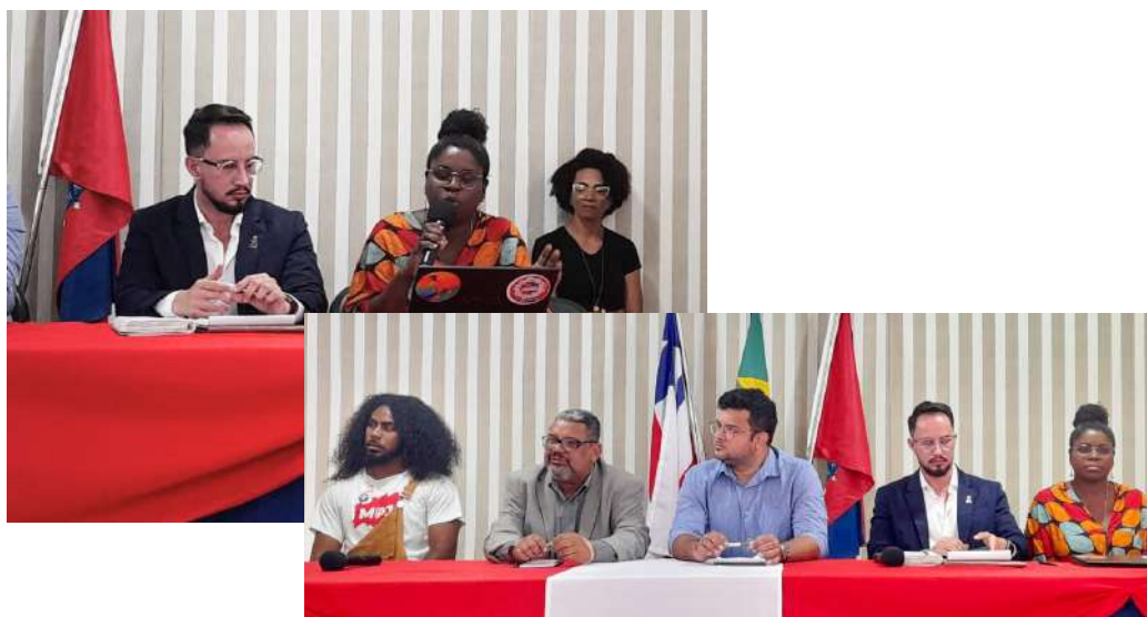
Mesa Institucional do 3º dia da Semana de Integração UNEB 2024.1