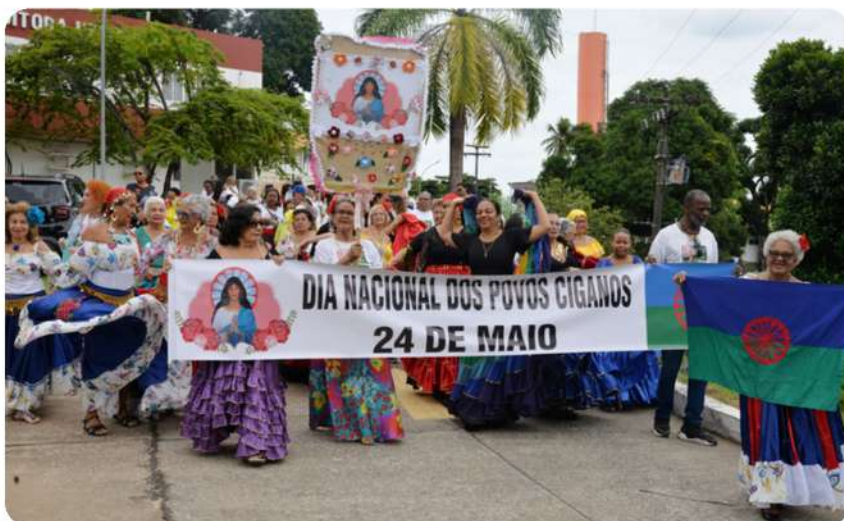
Evento visou reconhecer a contribuição da etnia cigana na formação da identidade cultural brasileira

O evento teve como objetivo reconhecer a contribuição da etnia cigana na formação da identidade cultural brasileira. A atividade contou com a participação da comunidade externa e dos estudantes do Programa Universidade Aberta à Terceira Idade (Uati) da universidade.