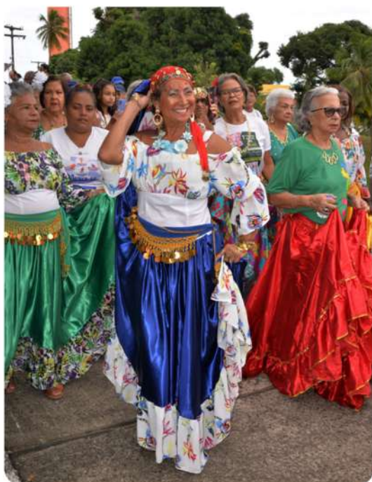
Atividade contou com a participação dos estudantes da Uati

maior visibilidade aos povos ciganos que compõem a população brasileira.