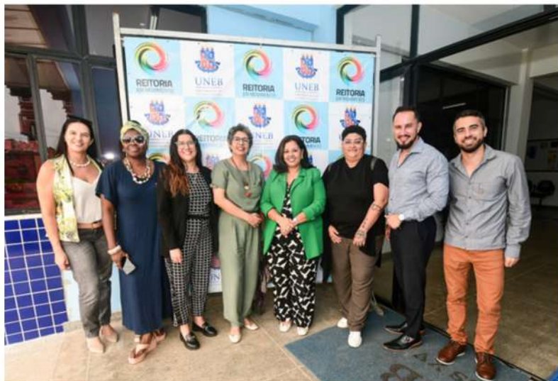
Administração central no DCH-XV, em Valença, durante a 7ª edição do Reitoria em Movimento