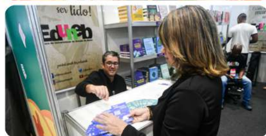
Stand da EdUNEB na Bienal do Livro 2024