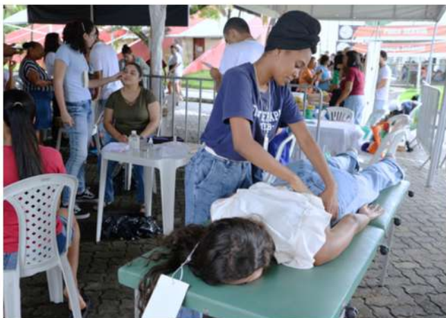
Feira Servir UNEB ofertou serviços de saúde, educação, cultura, lazer e esporte para o público