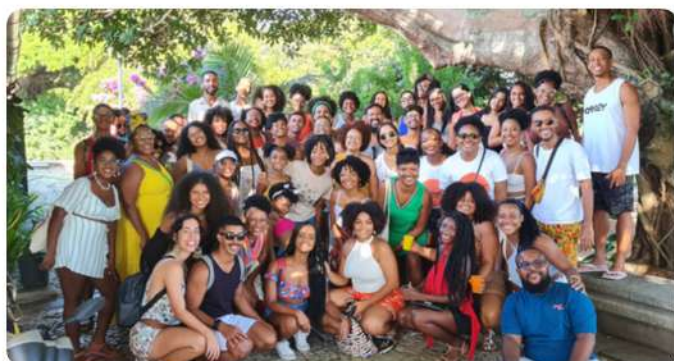
Ações incluem estudantes, docentes, pesquisadores, comunidades e diversos profissionais

As ações do projeto permitiram a inserção de abordagem teórico-conceitual sobre racismo, antirracismo e exercício de políticas de saúde como direito humano, na formação de estudantes tanto das graduações em saúde quanto do ensino médio assistidos pelo projeto.