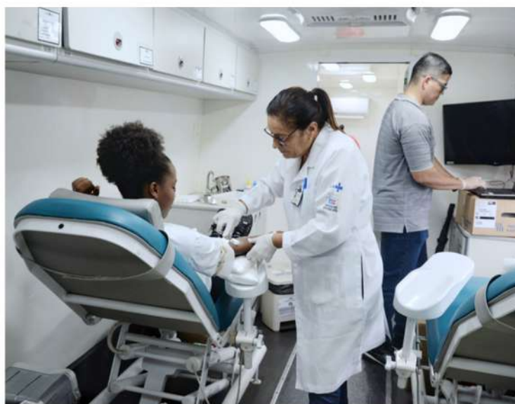
Feira Servir UNEB: atendimento médico

A feira contou com a participação de diversas instituições parceiras, como o Serviço de Atendimento ao Cidadão (SAC), Sine Bahia, Fundação de Hematologia e Hemoterapia da Bahia (Hemoba) e a Secretaria Municipal de Saúde de Salvador (SMS), que aplicou vacinas contra a influenza. A iniciativa visou aproximar a universidade da comunidade externa, promovendo educação, bem-estar social e integração.