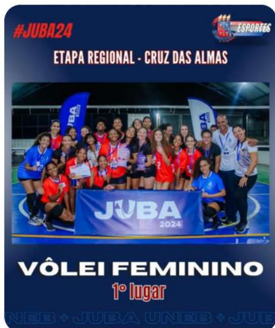
Vôlei feminino em 1º lugar