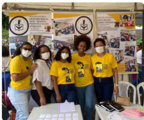
Stand Axé Saúde no evento