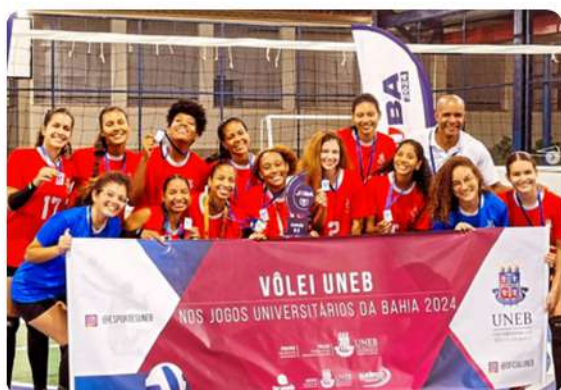
Campeãs do vôlei UNEB na etapa regional do Juba

No dia 4 de maio, as equipes representantes da UNEB continuaram a se destacar nos jogos de vôlei, basquete, handebol e futsal. No dia 5 de maio, ocorreram as finais das modalidades, com a UNEB participando de várias delas. A participação da universidade foi uma das melhores em comparação com edições anteriores dos Jogos. A PRAES deu suporte à participação das delegações por meio de investimentos em auxílios para alimentação, água, transporte e outros recursos técnicos.