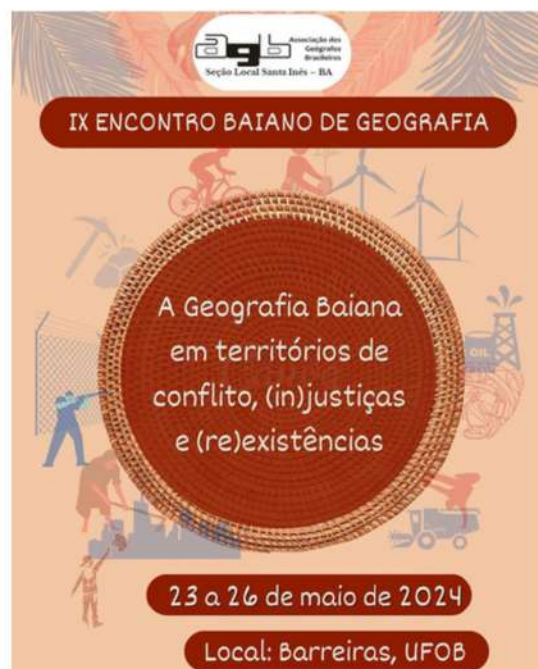
Identidade visual do evento

Também por meio de concessão de transporte, a PRAES enviou 46 participantes ao evento. O evento, que teve como tema "Geografia Baiana em territórios de conflitos, (in)justiças e (re)existências", contou com uma ampla programação, incluindo mesas-redondas, minicursos, palestras e visitas de campo.