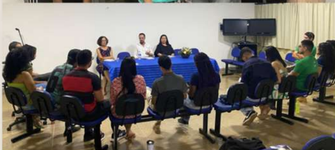
Encontro DA, CA e MCE no campus de Barreiras

corretamente as questões para a sua resolução.