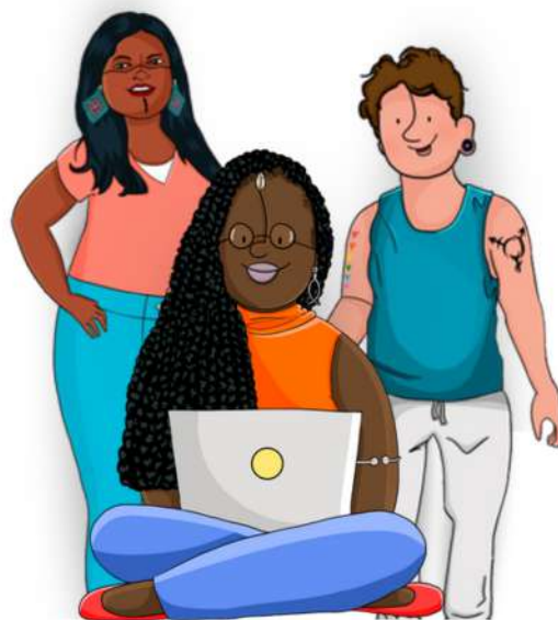
Personagens ilustrados em representação aos 15 anos da PRAES

Por meio do setor de Estágio, a UNEB atendeu estudantes beneficiários dos programas Mais Futuro e Partiu Estágio, que ingressaram em vagas de estágio oferecidas a partir das convocações realizadas pela Secretaria da Administração do Estado da Bahia (SAEB) por meio dos Programas Mais Futuro e Partiu Estágio.