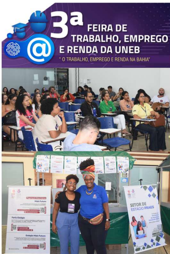
Presença da PRAES na 3ª edição da Feira de Trabalho, Emprego e Renda da UNEB